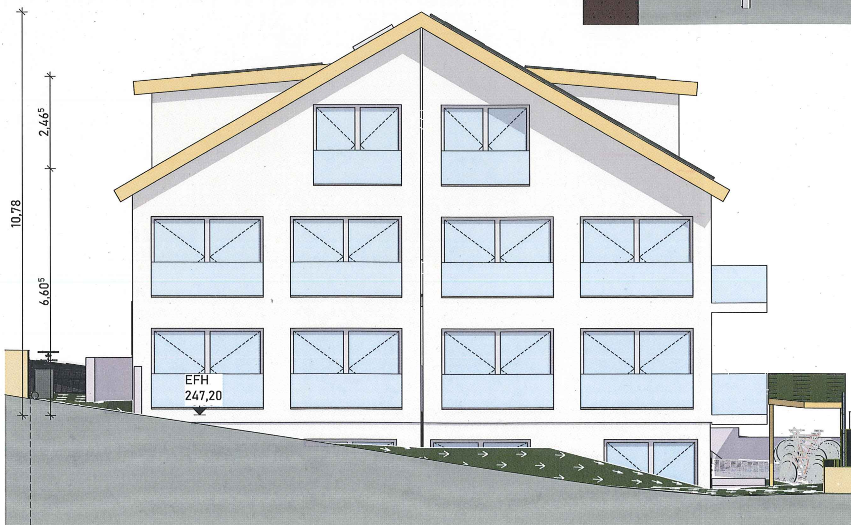
Ansicht Westen Grenze