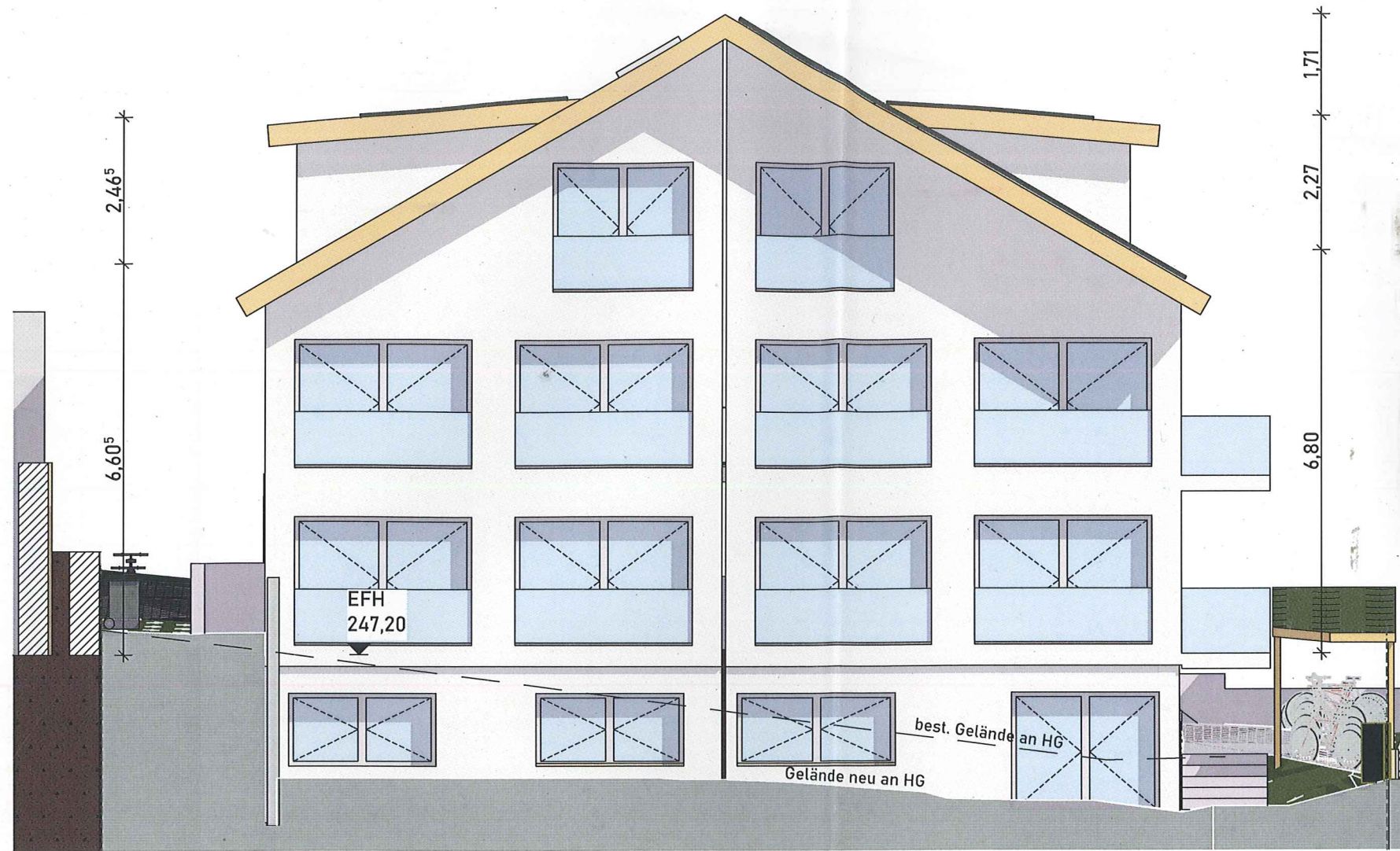
Ansicht West Hausgrund